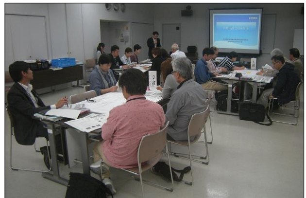
第15回策定委員会の様子

現在、公募市民等による「古賀市自治基本条例（仮称）策定委員会」が中心となって条例に盛り込む内容を検討しています。